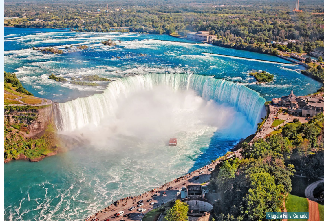
Niagara Falls, Canadá